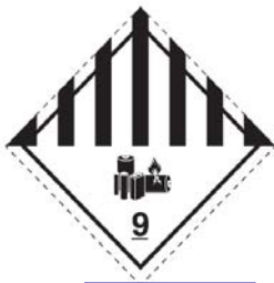
第 9 类危险性标签—锂电池 (100 mm×100 mm)